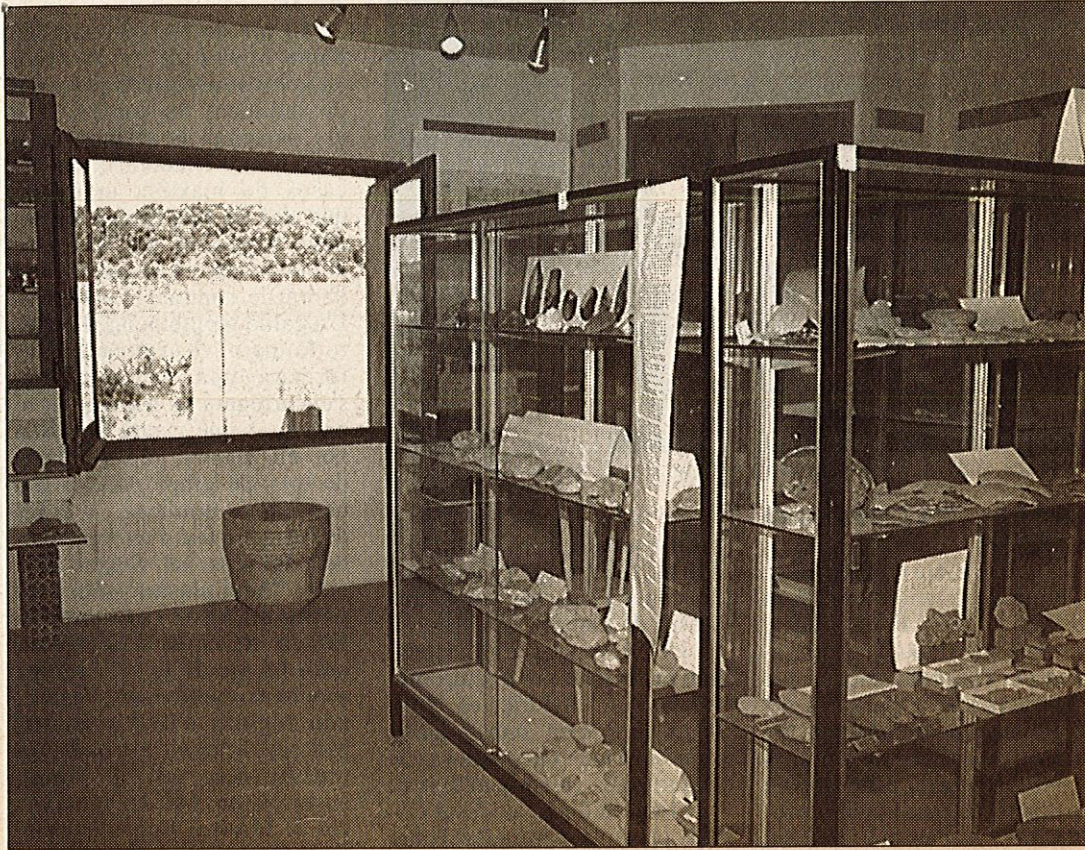
La col·lecció té una secció d'arqueologia i una de paleontologia